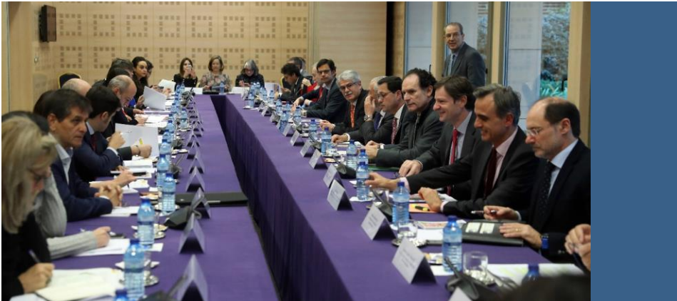
Grupo de Alto Nivel para la Agenda 2030

Dirección de Cooperación para el Desarrollo