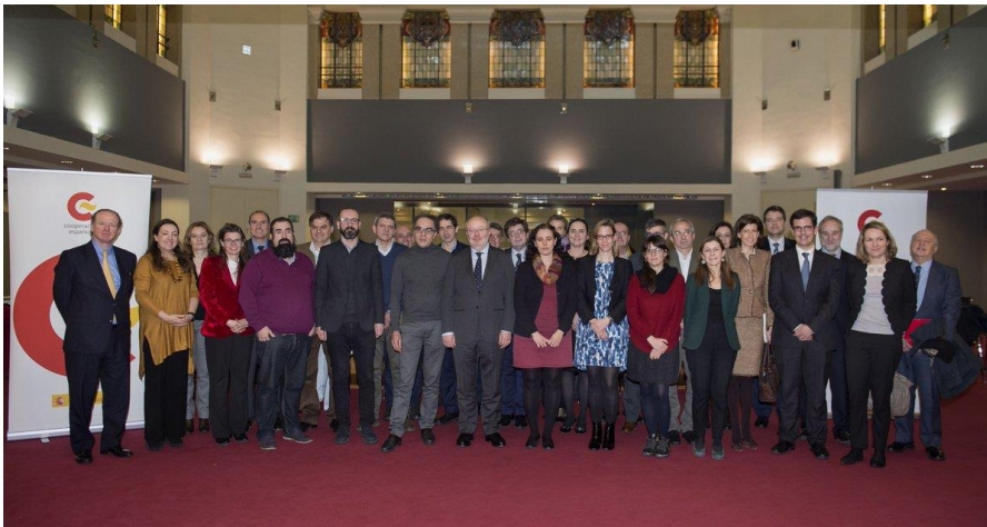
Pleno del Consejo de Cooperación del 16 de febrero de 2018 donde se debatió sobre el V Plan Director de la Cooperación Española