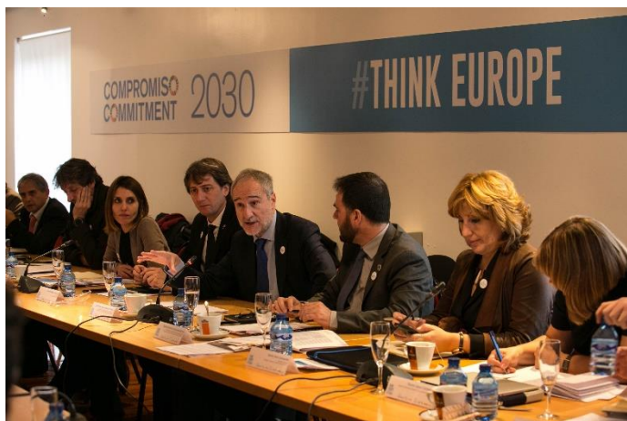
La Vicepresidenta del Gobierno, Soraya Sainz de Santamaría inaugura el "Think Europe Compromiso 2030"

El encuentro fue inaugurado por la Vicepresidenta del Gobierno, Soraya Sainz de Santamaría, puedes verlo aquí .