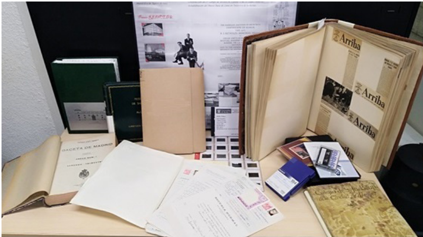
Ilustración 2 Fondos del AUAH