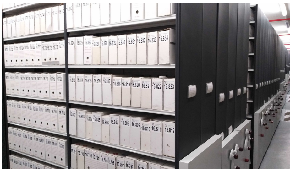
Ilustración 1