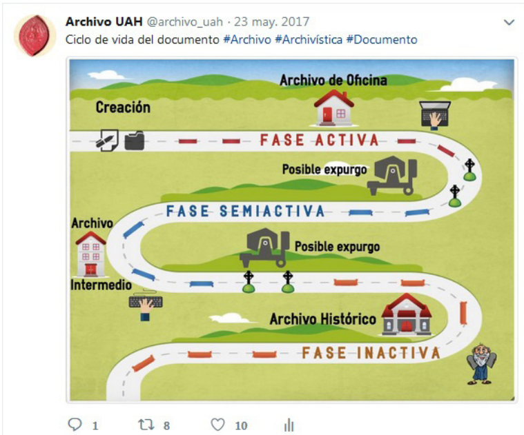
Ilustración 3 Infografía publicada en Twitter

En las redes sociales se difunde el material digitalizado audiovisual e histórico, dando un valor añadido a estos documentos.