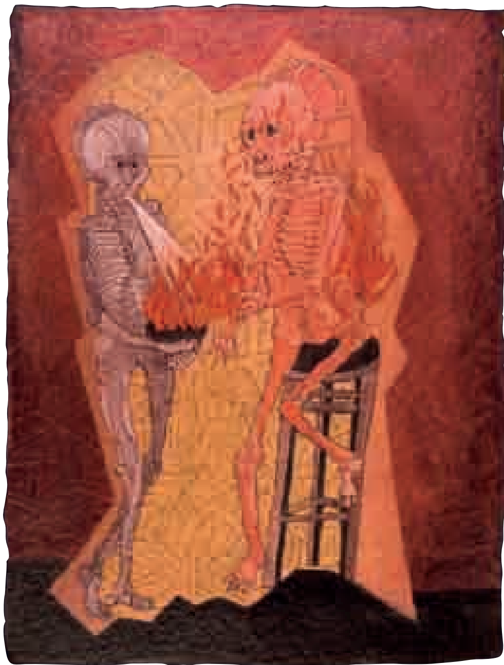
S/T | 1xxx | XX x XX cm. TÉCNICA MIXTA | PAPEL HECHO A MANO