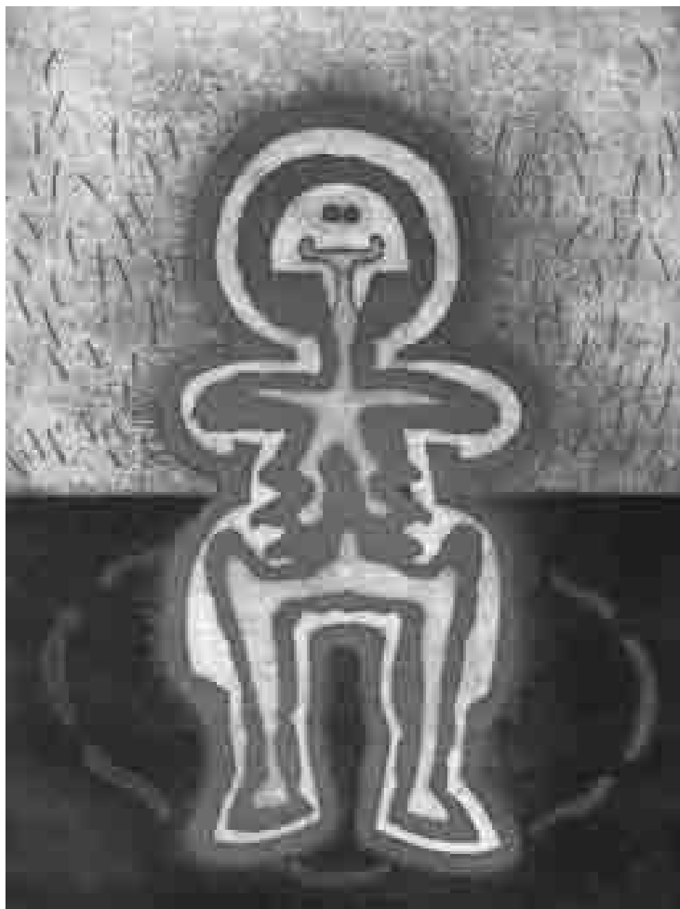
Gran kantulé | 1988 | 49 x 37 cm. AGUAFUERTE