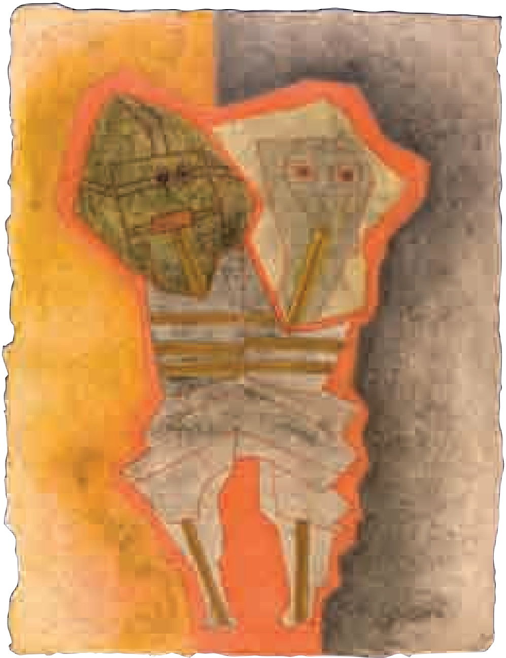
S/T | 1xxx | XX x XX cm. TÉCNICA MIXTA | PAPEL HECHO A MANO