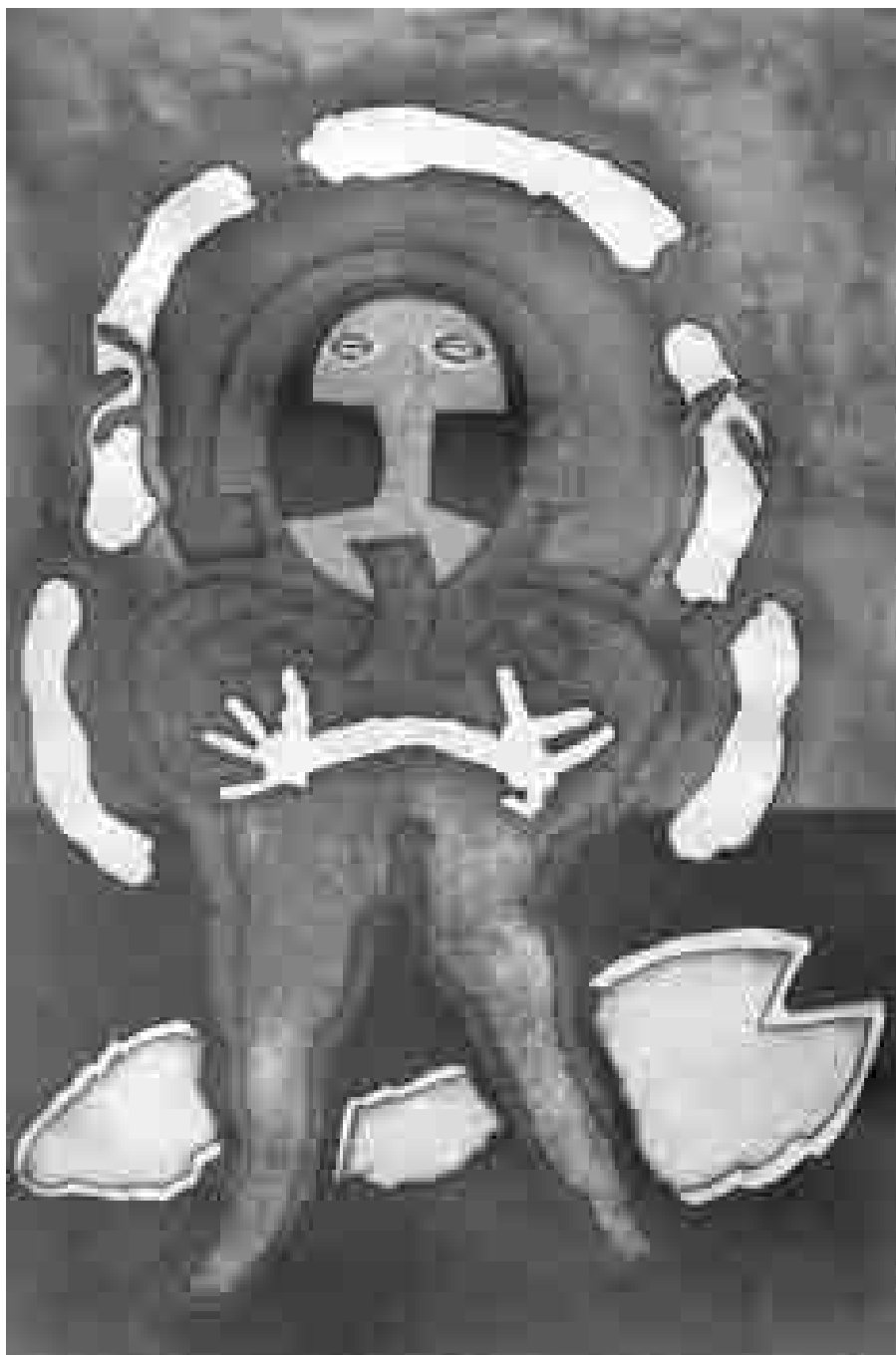
Componedor | 1992 | 74 x 50 cm. AGUAFUERTE