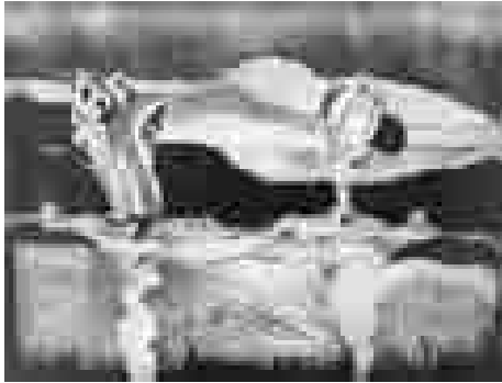
Bañistas | 1979 | 48 x 64 cm.

Goya – y poquísimos nombres más – aparte, el grabador español no pasó de ser, hasta principios del siglo XX, un sabio y paciente artesano. Su misión se redujo a ofrecer en libros y revistas imágenes de la actualidad, reproducciones de cuadros y esculturas, vistas de ciudades, retratos de famosos... Cuando la técnica vino en ayuda del arte, cuando el fotograbado liberó al grabado artístico de su condición servil, las cosas empezaron a cambiar. Dejó de ser el pariente pobre de la pintura y descubrió, además de sus posibilidades creadoras, sus peculiaridades técnicas. Fue algo tan sencillo y tan sorprendente como si un pianista advirtiese que el piano no sirve solo para acompañar a una cantante, sino que puede dar forma sonora a composiciones creadas exclusivamente para él.