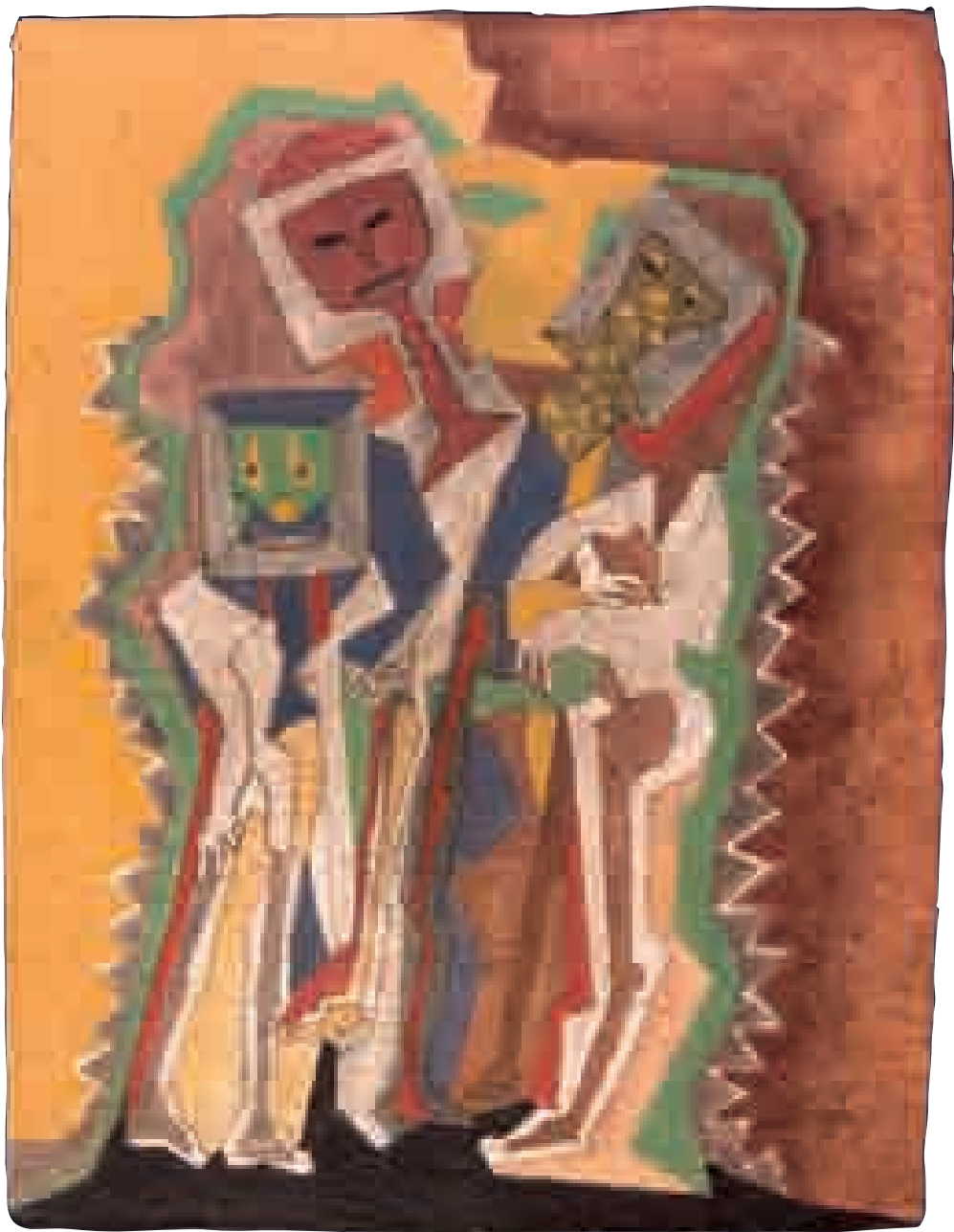
S/T | 1xxx | XX x XX cm. TÉCNICA MIXTA | PAPEL HECHO A MANO