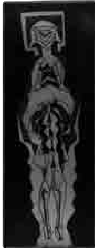
Romance vertical (serie, 3) | 2005 | 42 x 15 cm.

He aquí, para terminar, un artista que, sin caer jamás en la literatura, ha puesto su gramática plástica al servicio de la más desconcertante y alucinada poesía.