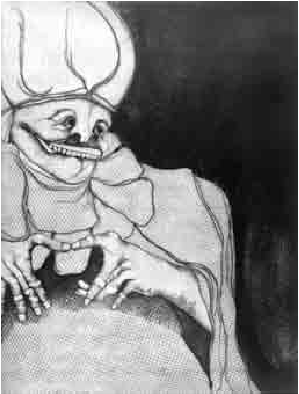
Habitante | 1964 | 64 x 48,5 cm. AGUAFUERTE