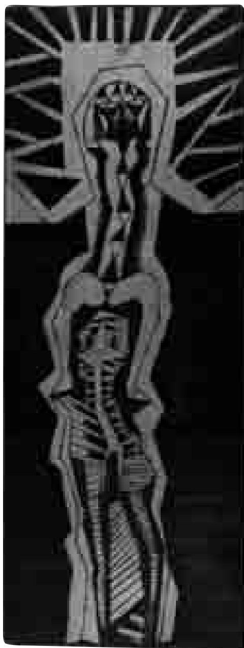
Hombre zaino | 1992 | 74 x 50 cm. AGUAFUERTE