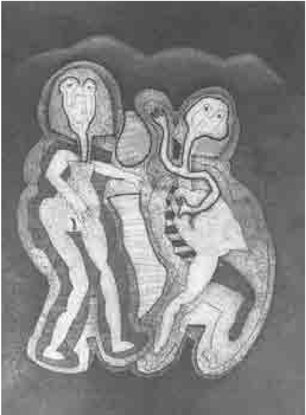
Juego nocturno | 1990 | 49 x 36,5 cm.