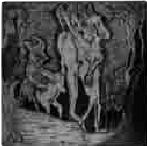
Bacanal salvaje (serie, 4) | 2005 | 24 x 24 cm. AGUAFUERTE