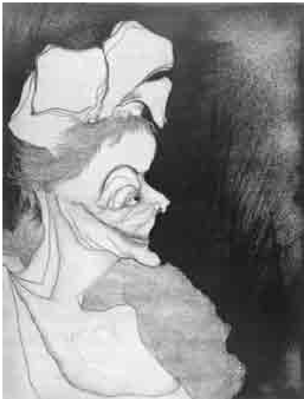
Habitante | 1964 | 64 x 48,5 cm. AGUAFUERTE