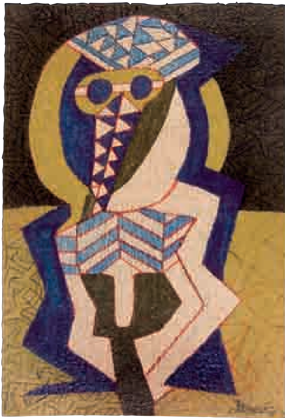
S/T | 1xxx | XX x XX cm. TÉCNICA MIXTA | PAPEL HECHO A MANO