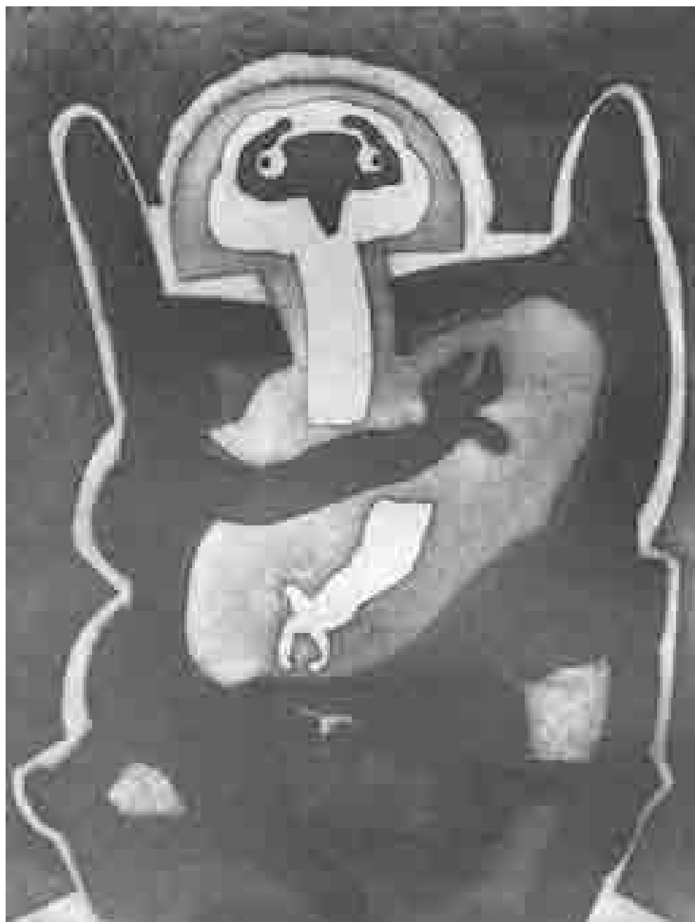
Maldentada | 1988 | 49 x 37 cm. AGUAFUERTE