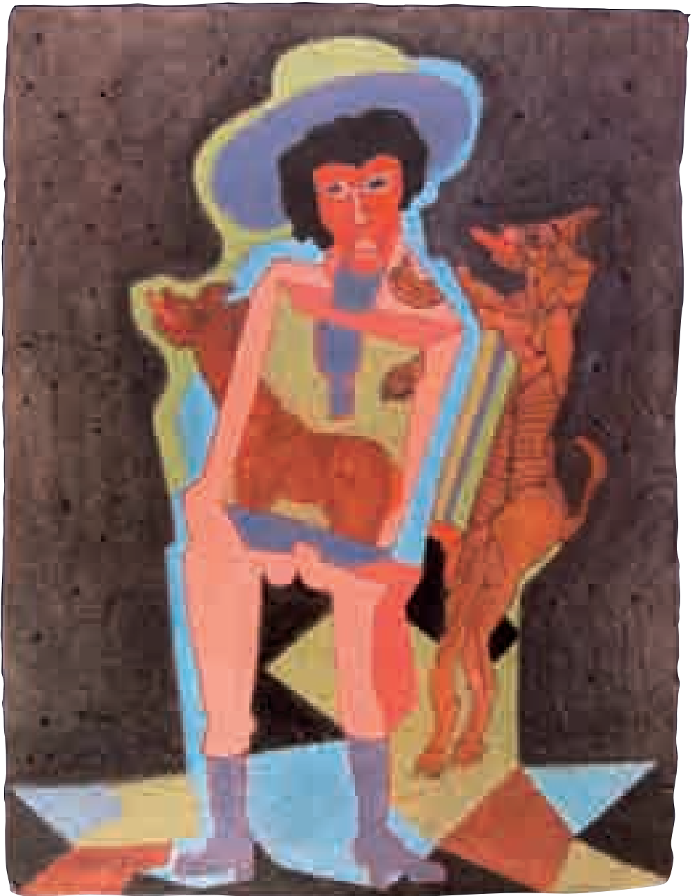
S/T | 1xxx | XX x XX cm. TÉCNICA MIXTA | PAPEL HECHO A MANO