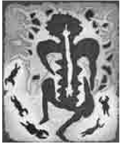
La maniagua (serie, 6) | 1985 | 29,5 x 23,5 cm. AGUAFUERTE