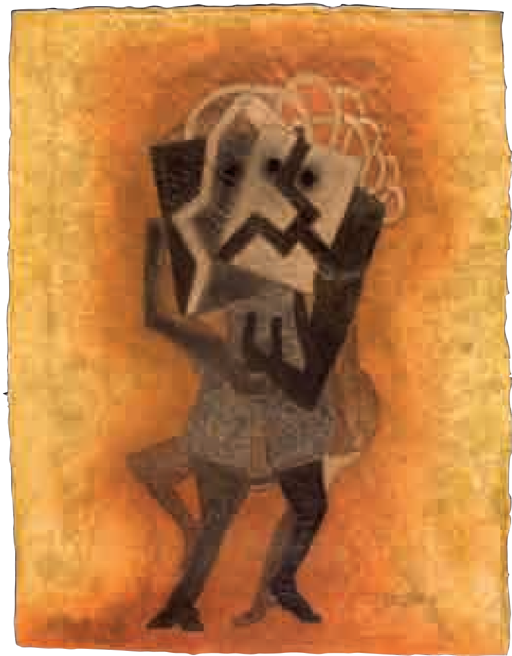
S/T | 1xxx | XX x XX cm. TÉCNICA MIXTA | PAPEL HECHO A MANO